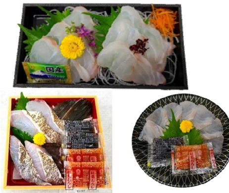
ブランド養殖魚「錦クエ」