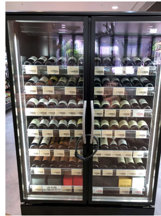
高級ワインセラー