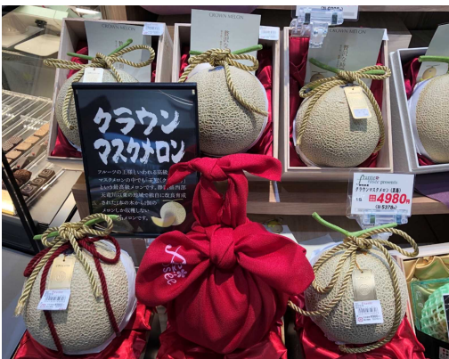
ギフト用クラウンマスクメロン