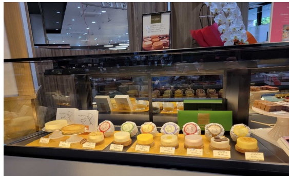
60DAYS ミルクのショコラ、ヴァイスバーレンのショコラ、D's チーズのチーズケーキ