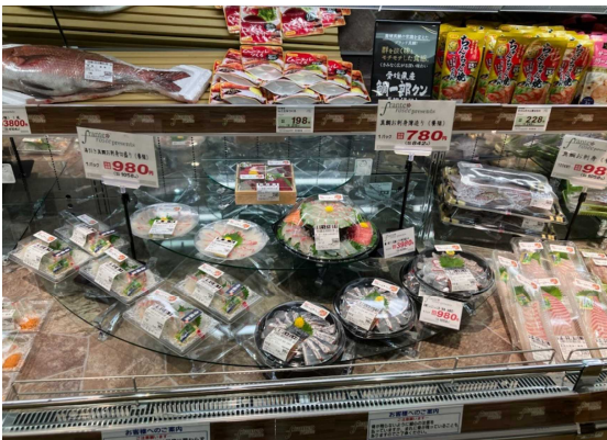
ブランド養殖魚「鯛一郎くん」