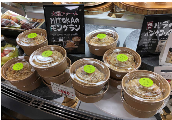
大賀ファーム MITOKA のモンブラン