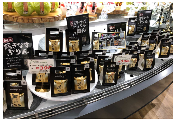
レストラン雅の野菜プリン