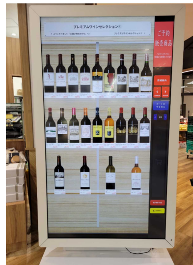
商品を予約販売できるデジタルサイネージ