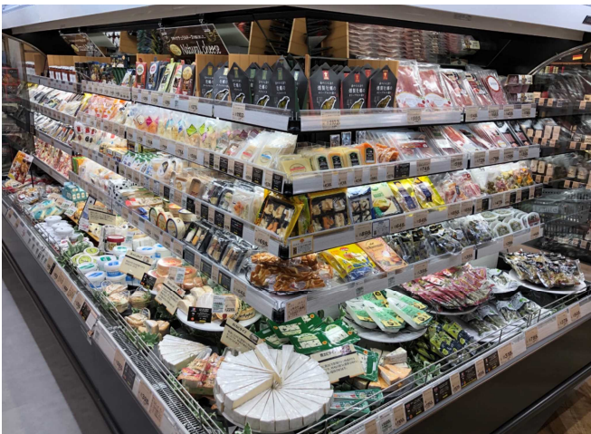
ワインに合うチーズコーナーも充実