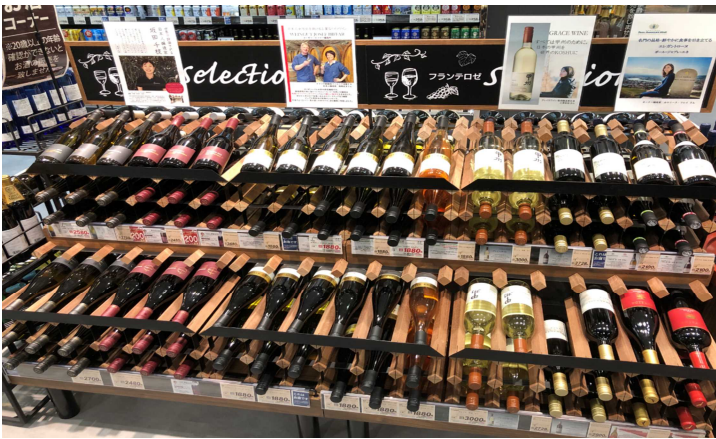
女性ソムリエの厳選ワインコーナー