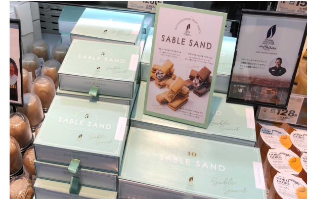
シェ・シバタのバターサブレサンド