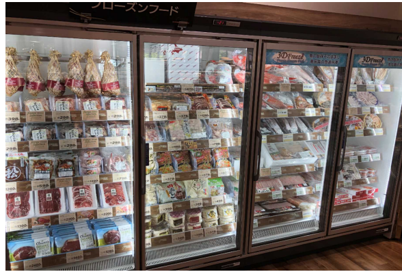
生ハムや刺身で食べられる魚など冷凍で展開