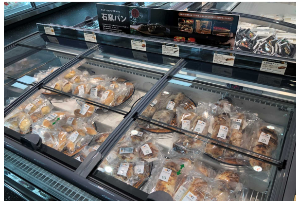
GURUMAN VITAL のフローズン石窯パン