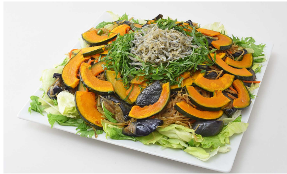
舞坂産ちりめんと秋野菜の和サラダ