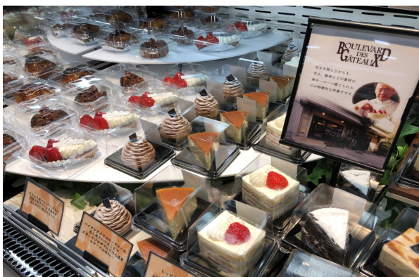
ブルヴァール・デ・ガトーのケーキ