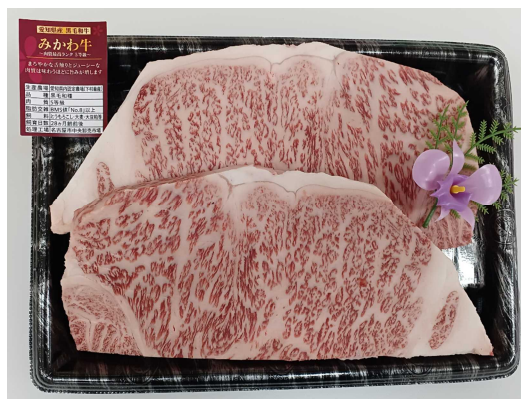
みかわ牛（5等級）のステーキ