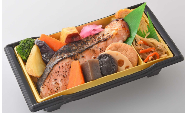
佐藤水産秋鮭さざ浪漬とたっぷり野菜のお重