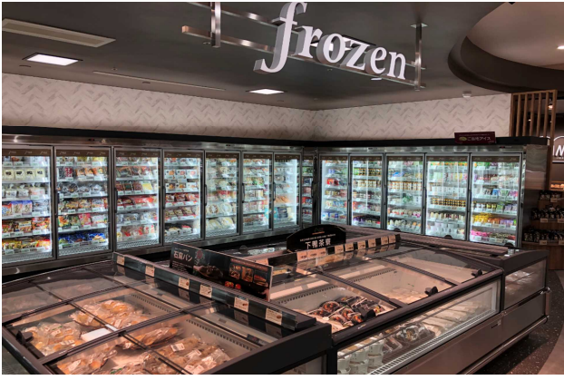
新たにコーナー化されたフローズンコーナー