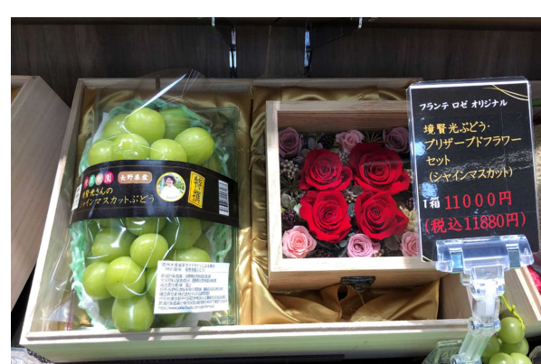
シャインマスカットとブリザードフラワーのギフト