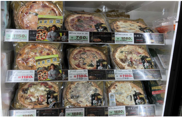
チェザリの冷凍ピッツァ