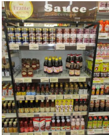
地元から地方まで人気商品を集めたソース売場