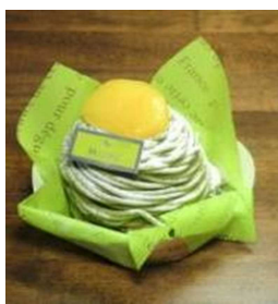
風味豊かな抹茶ムースモンブラン