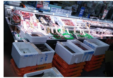
市場をイメージした魚売場