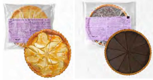
フランス産の新規導入商品、リンゴタルトとチョコタルト