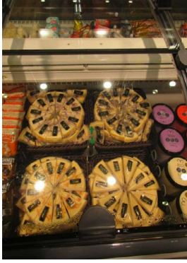
人気ニューヨークチーズケーキ