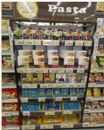
フランテこだわりのパスタ売場