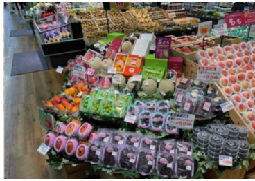
種類豊富な果物売場