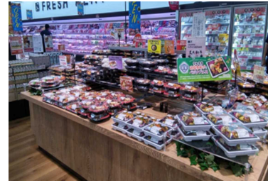
豊富な出来立て商品がある惣菜売場