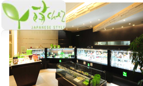
安田店の地元洋菓子店「萌 chez」