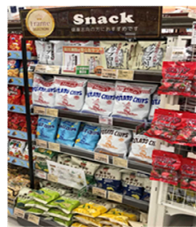
素材にこだわった菓子売場