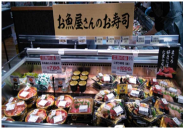
魚売場の素材を使ったお寿司