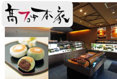
安田店の地元和菓子店「高砂本家」