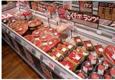
牛肉希少部位の販売を増加した肉売場